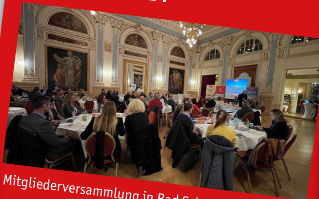
Mitgliederversammlung in Bad Schandau