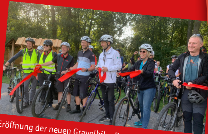
Eröffnung der neuen Gravelbike-Route „Rock Head“