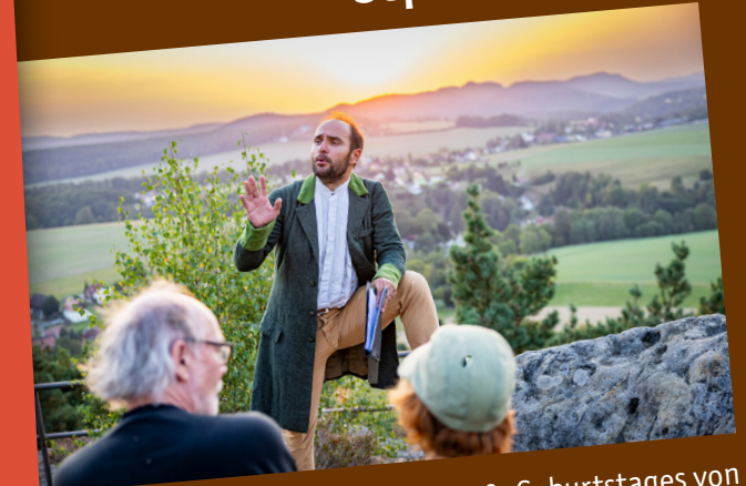
Picknick zum 250. Geburtstages von Caspar David Friedrich