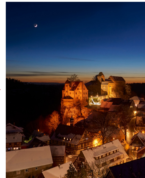
Hohnstein im Winter

Zum Auftakt des Kulturfestivals wird es am 01.02.25 erstmals in Pirna eine Winter-Hofnacht geben.