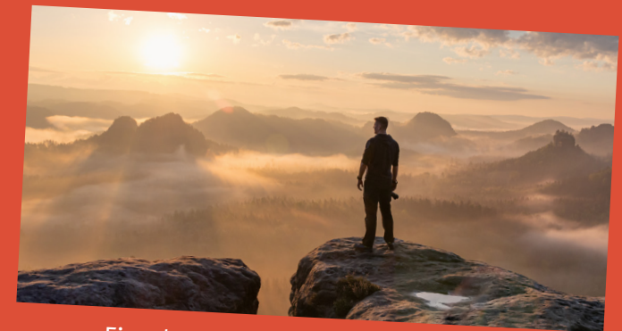
Eins der Gewinnerbilder des Fotowettbewerbs „Impressionen der Romantik“ (Ausschnitt)