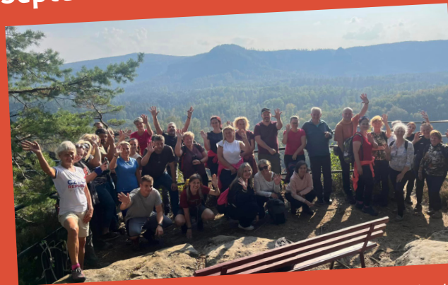
50 böhmische Kollegen auf Exkursion in der Sächsischen Schweiz