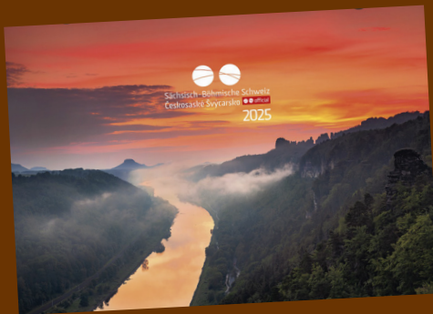
Kalender Sächsisch-Böhmische Schweiz 2025 erschienen